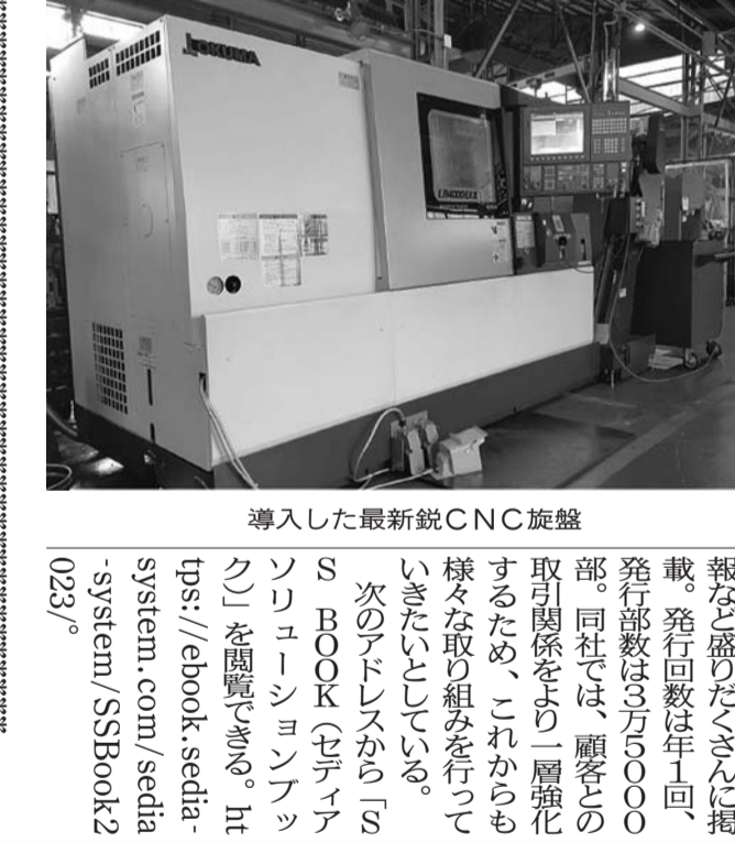
導入した最新鋭CNC旋盤

インシザキとの特許権侵害訴訟に勝訴。スリーエム工業(本社、東京都大田区)は、スリーエム工業(本社、東京都大田区)に、インシザキの特許権を侵害しているとして、損害賠償を求めた。