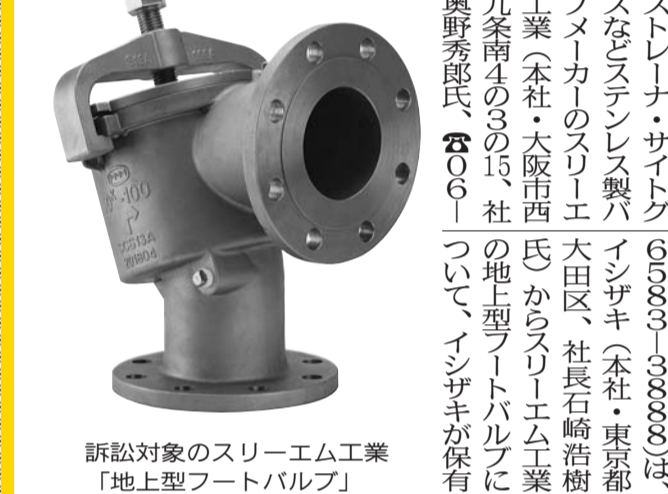
訴訟対象のスリーエム工業「地上型フットバルブ」

昭和ハルバ製作所(本社工場)は、生O日H6面A付付で、生産性の向上と国際的な競争力の向上を図るため、CNC旋盤とMCを導入した。